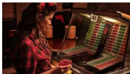
Le GIF più belle del mondo