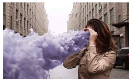
Ritratti surrealisti con GIF animate