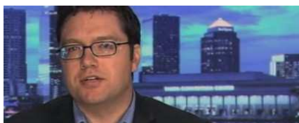
L'uomo delle GIF