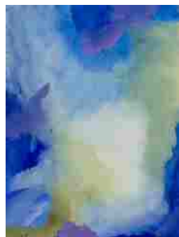
P #56, 2015, tecnica mista, 18x24 cm [Vedi la foto originale]

smART - POLO PER L'ARTE vai alla scheda di questa sede Exibart.alert - tieni d'occhio questa sede Piazza Crati 6/7 (00199) +39 06 99345168 esposizioni@smartroma.org www.smartroma.org individua sulla mappa Exisat individua sullo stradario MapQuest Stampa questa scheda Eventi in corso nei dintorni