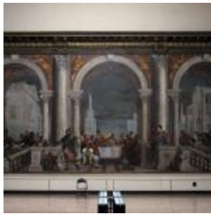
Bologna Updates: 100mila (euro) per 8 (opere). Artefiera ha un nuovo fondo acquisizioni, nel ...