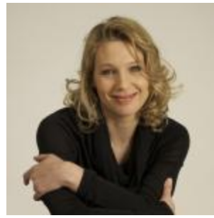
Un tedesco a Rovereto