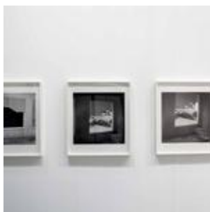
Da Annette Kelm allo stand Gio' Marconi a Elad Lassry da Massimo De Carlo. Ecco le acquisizioni ...